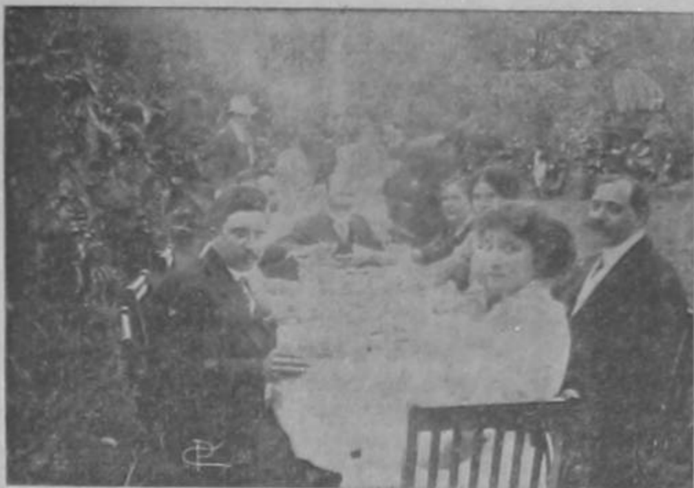
Preciosos grupos tomados por nuestro fotógrafo